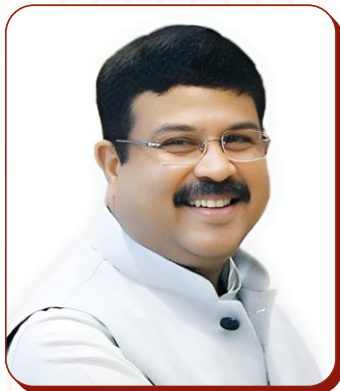
Shri Dharmendra Pradhan Hon'ble Education Minister