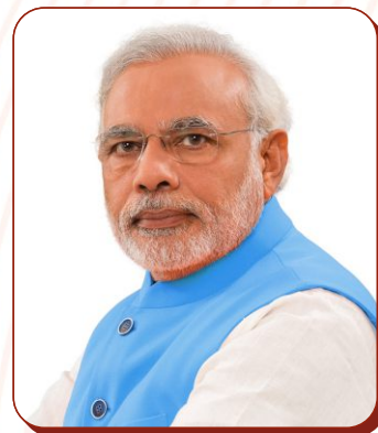
Shri Narendra Modi Hon'ble Prime Minister of India