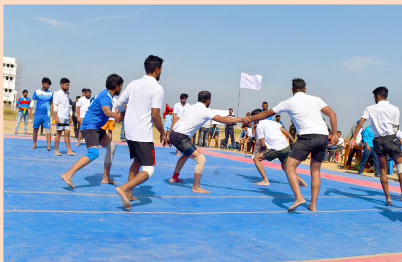
Glimpse of School of Education defending a raid from School of Law & Governance