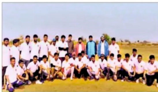
विजयी टीम के खिलाड़ी.