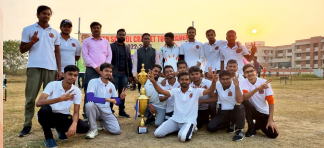
RUNNER UP SCHOOL OF LAW & GOVERNANCE ISCT(2022-23)