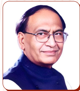
Dr. C. P. Thakur Chancellor, CUSB