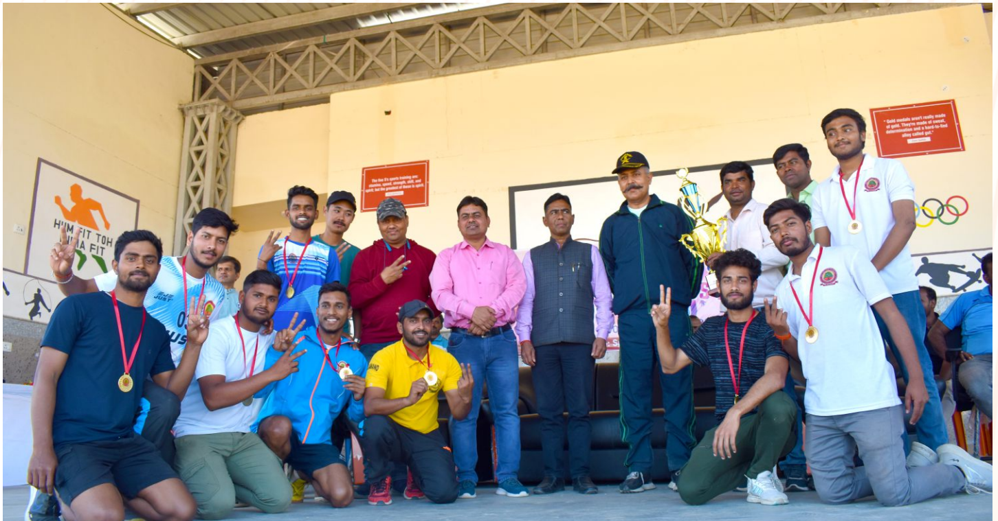
School of Education Winner Kabaddi Men 2022-2023