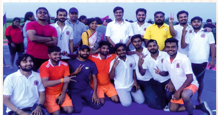
Team Arjuna 07 won the Kabaddi match by 69-59 against Team legal panthers.