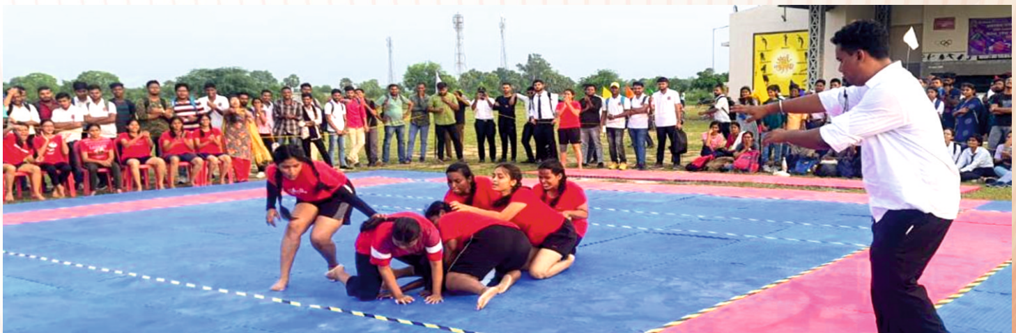
Intense Match situation during a girls kabaddi match.