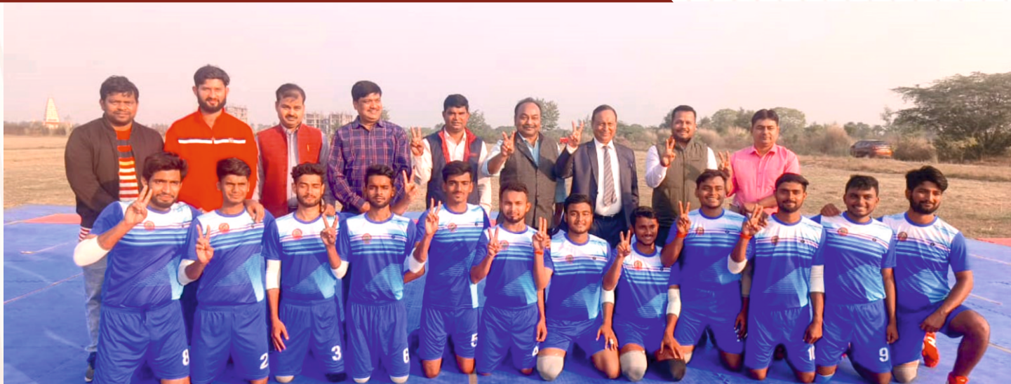
CUSB EAST ZONE INTER UNIVERSITY KABADDI MEN TEAM 2022-2023