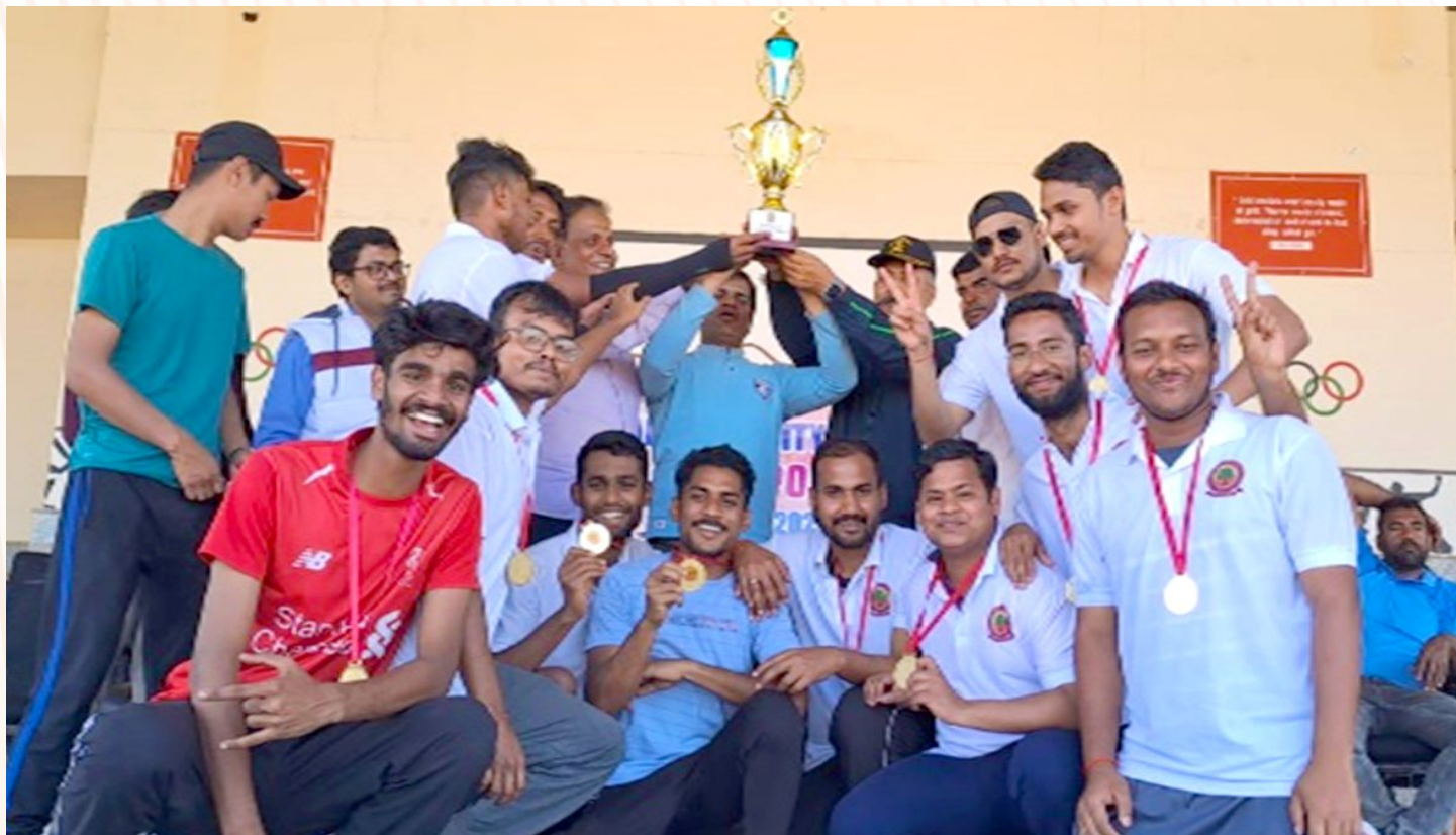
SCHOOL OF MATHEMATICS winner in Inter School Volleyball Men & Women Tournament