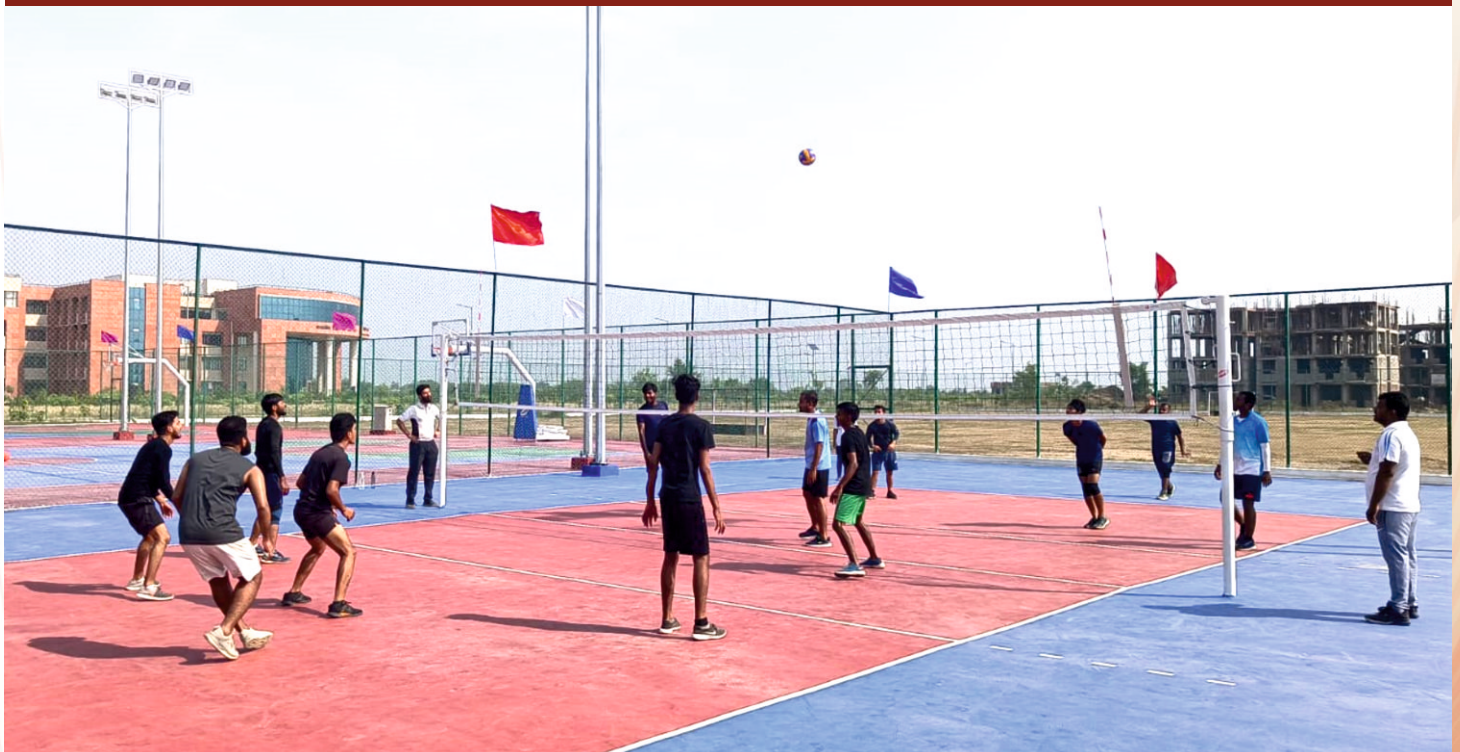
Exhibition Volleyball Match between Team Night Riders & Team Dynamite