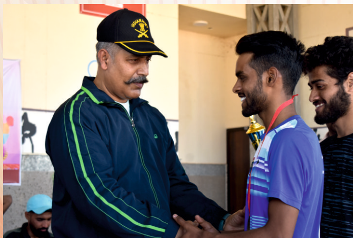
Felicitations of students