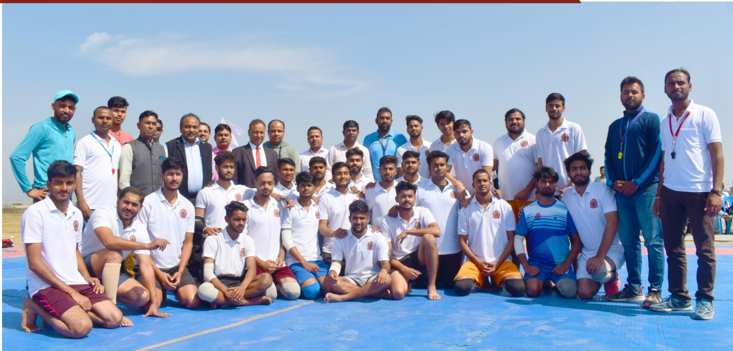
Men Kabaddi Final Match School of Education VS School of Law & Governance