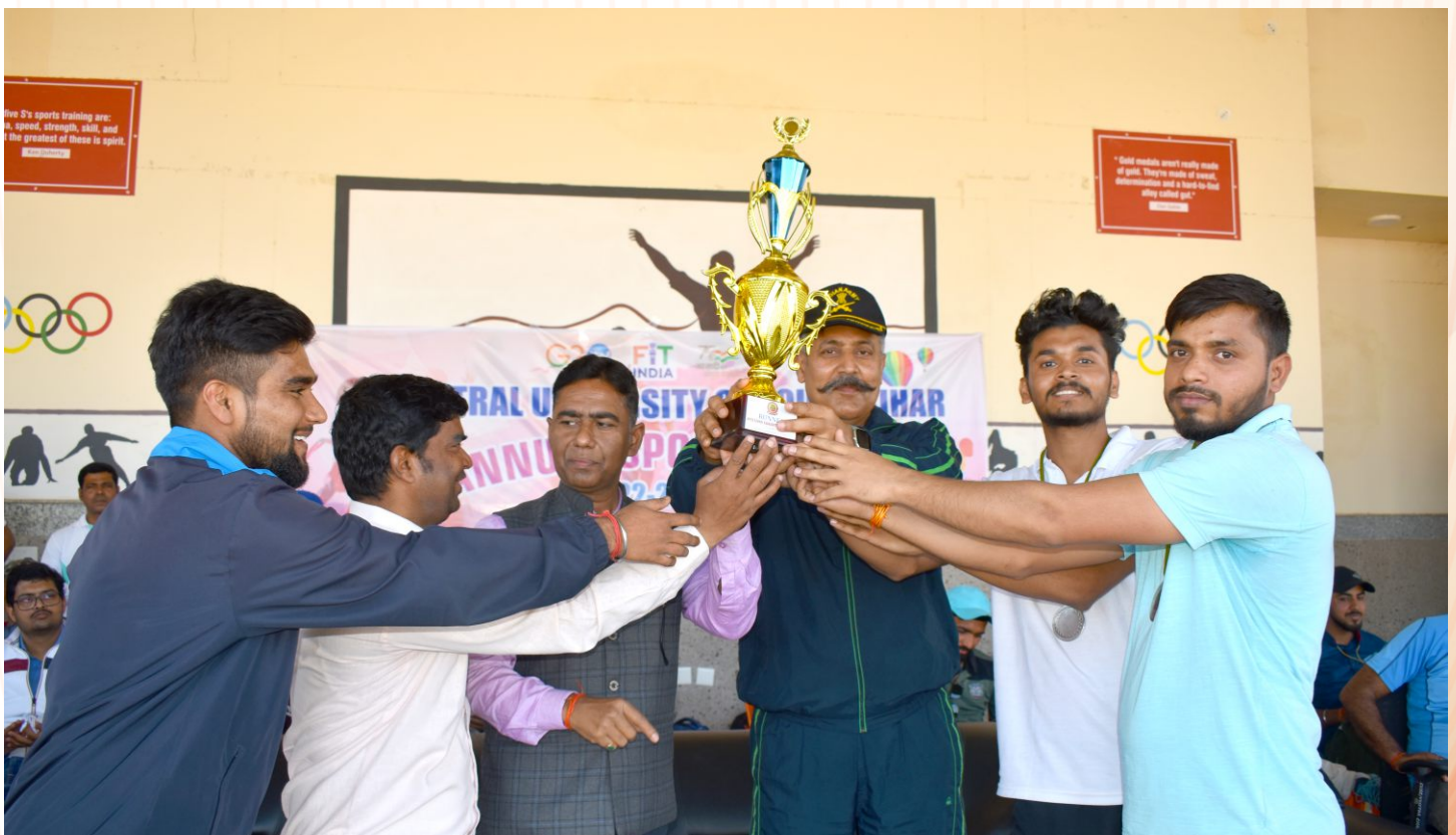
School of Law & Governance Runner-up Kabaddi Men 2022-2023