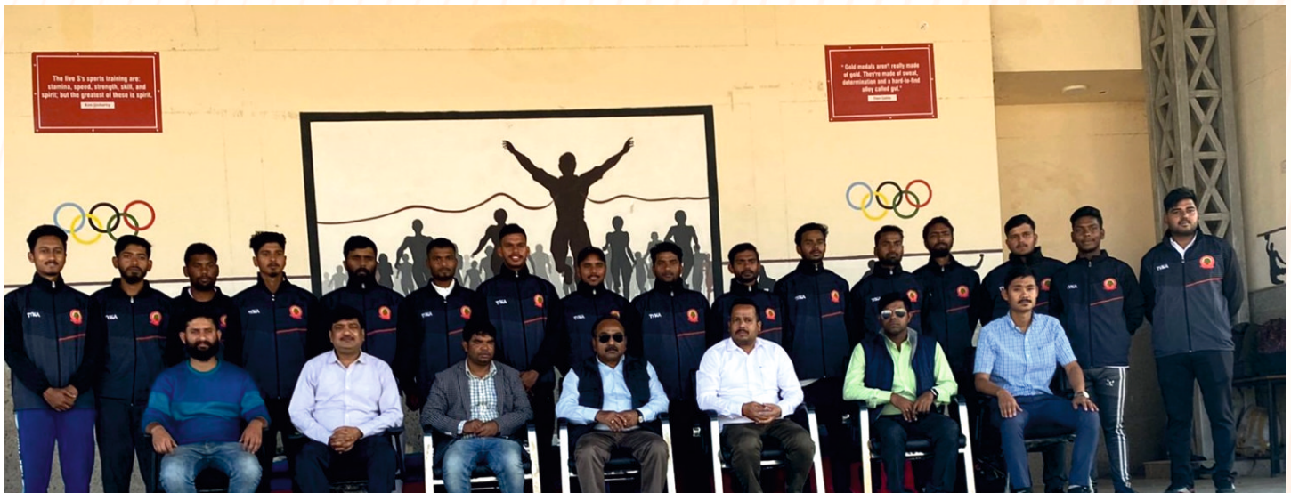
CUSB EAST ZONE INTER UNIVERSITY CRICKET MEN TEAM 2022-2023