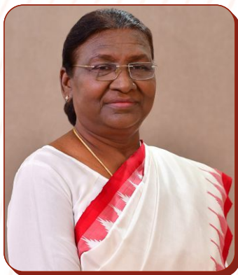
Smt. Droupadi Murmu Hon'ble President of India