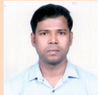
LABH DAS Research Scholar, Dept. Of Phy. Edu.