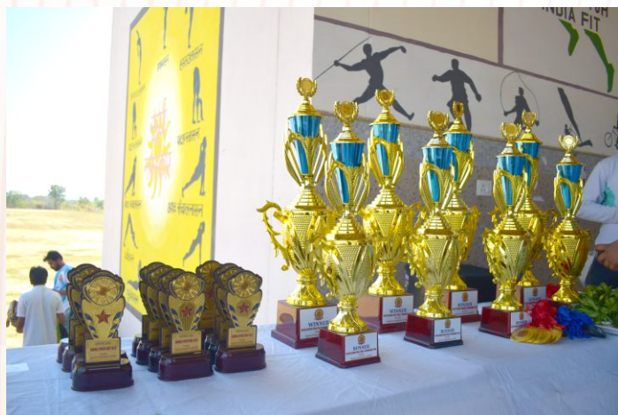
Trophies at a glance