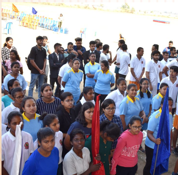
Participants Assembled for the opening ceremony of Annual Sports Day.