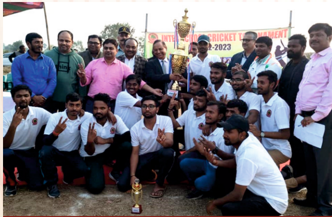
WINNER SCHOOL OF EDUCATION ISCT(2022-23)