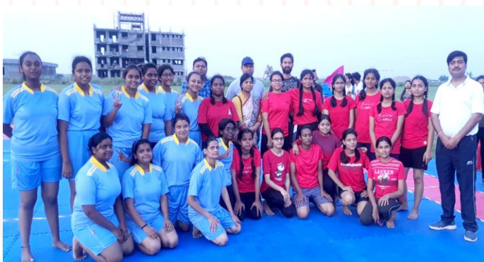
Team Sparkle in Blue won the Kabaddi match by 54-44 against Team Omicron in Red