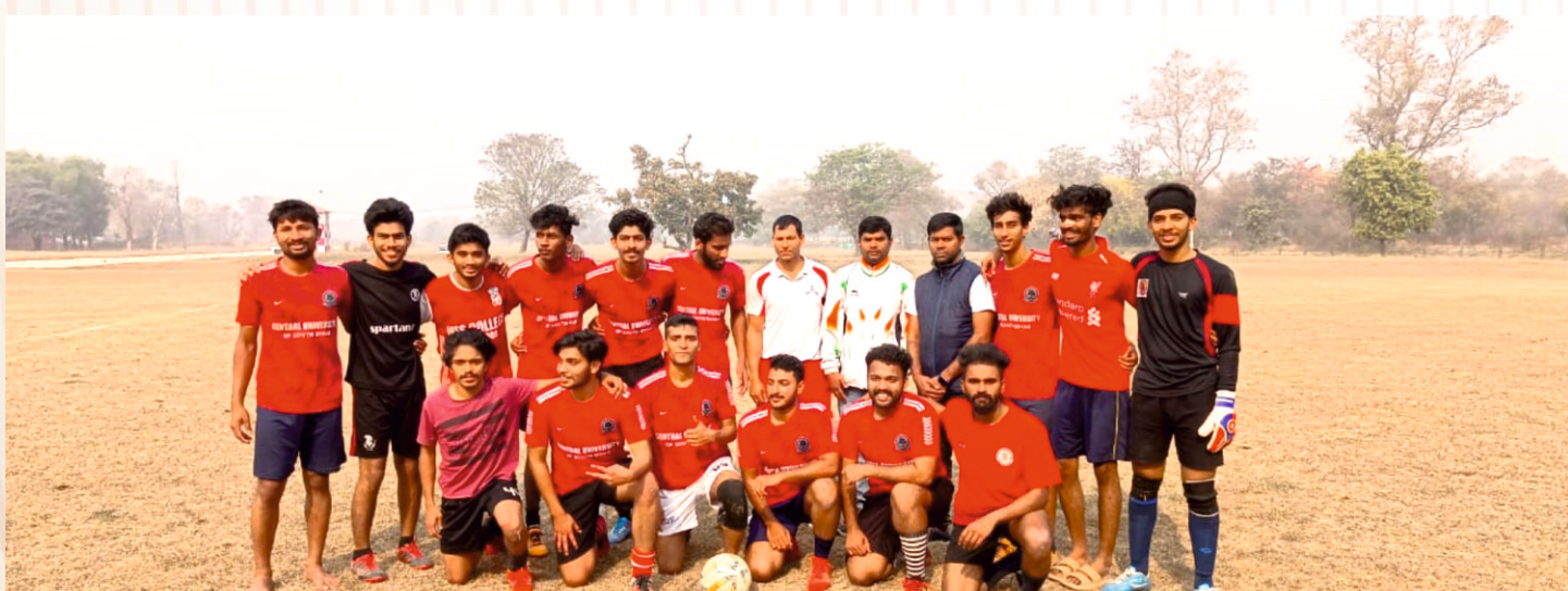
CUSB EAST ZONE INTER UNIVERSITY FOOTBALL MEN TEAM 2022-2023