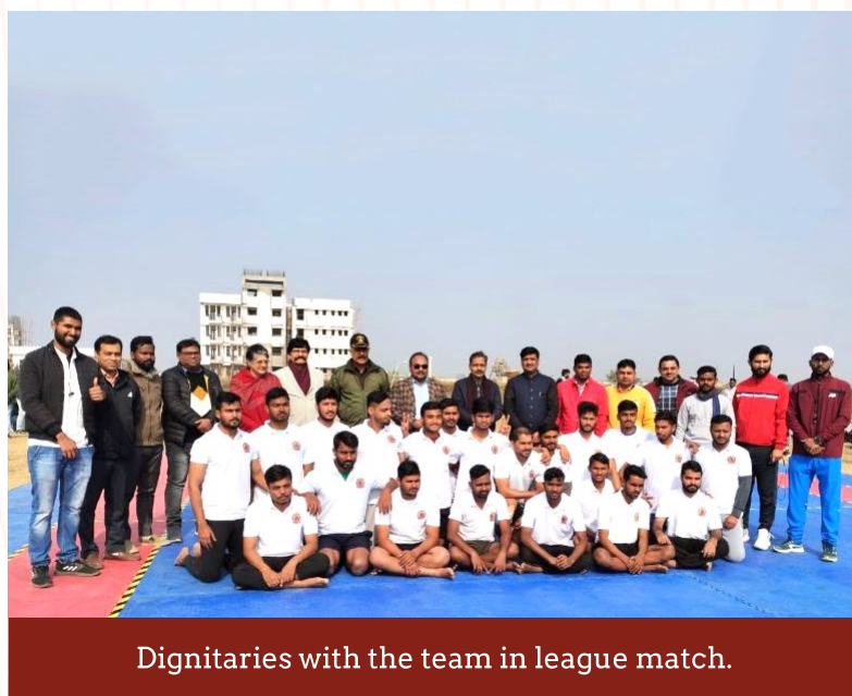
Dignitaries with the team in league match.