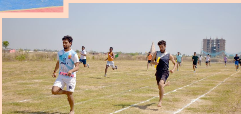
4 X 100 metre relay race